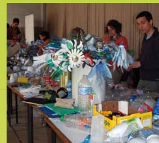
Ateliers de cerfs-volants

Pour construire la Fête dès maintenant, des ateliers de fabrication de cerfs-volants pour tout public permettront aux communes, aux associations locales de se mobiliser et de participer en amont de l'événement, les week-ends des 22-23 et 29-30 mai au château de Jambville, et le jour même de la Fête.